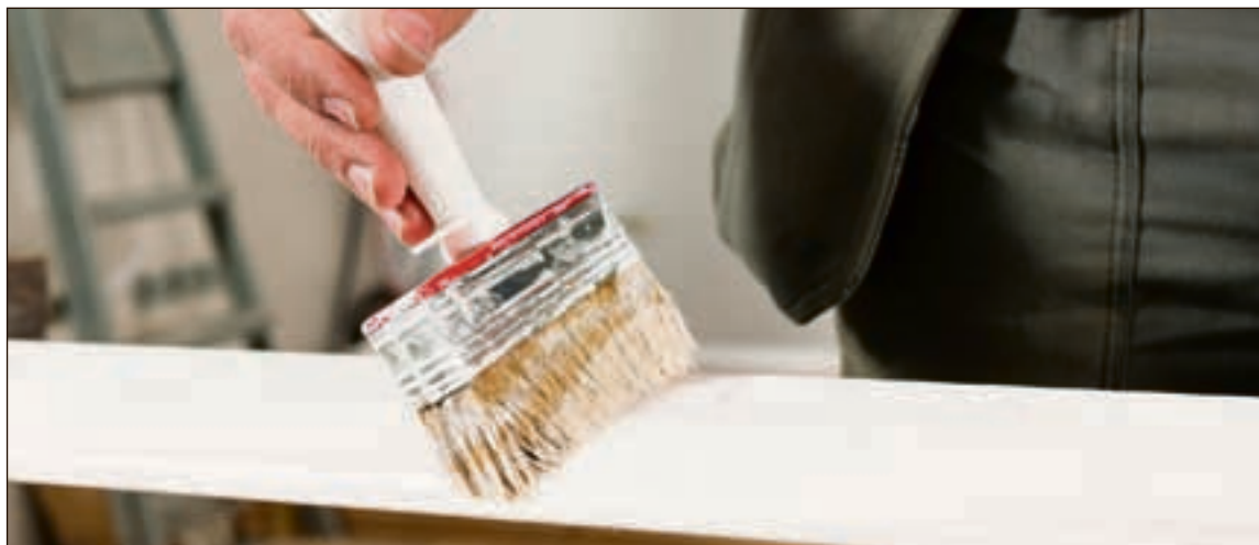
► Piretti, des professionnels dotés d'un savoir-faire reconnu.